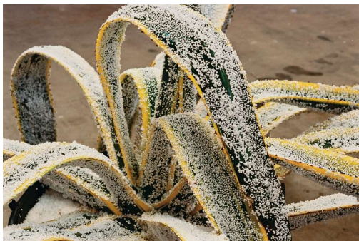
Sans-titre , Agave, polystyrène, La plante en nous, Haus der Kunst, Munich, 2000