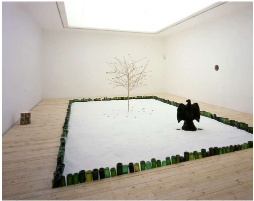
Psycho jardin , bronze, marble powder, glass bottles, frozen black ink, wood (2002)