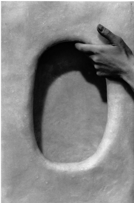
Savon femme , silver photograph (1991)