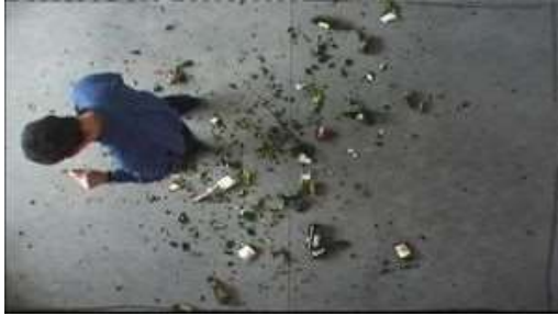
Autoportrait contre nature , videostill, (2002)