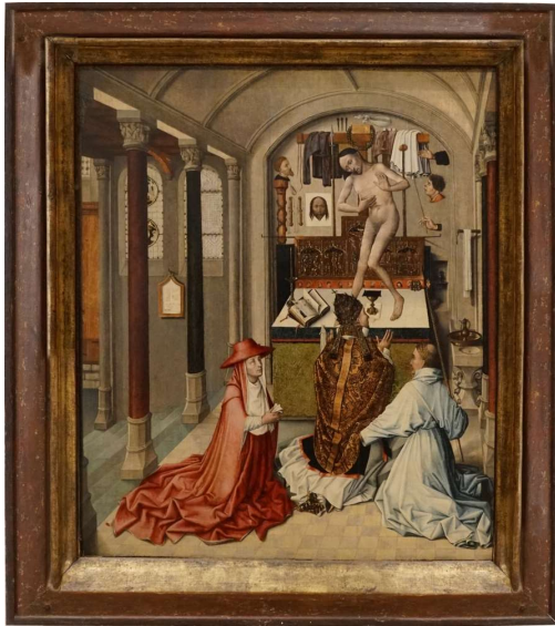
La messe de Saint Grégoire , Robert Campin/Maitre de Flémalle. Huile sur toile, dernier quart du XVe s. Musées Royaux des Beaux-Arts de Belgique, Bruxelles

Michel François est passionné par les résurgences passées et présentes dans notre histoire culturelle comme en témoignent La messe de Saint Grégoire de Robert Campin et Le bâilleur de Pieter Bruegel l'Ancien (?), appartenant tous deux à la collection des Musées royaux des Beaux-Arts de Belgique, mais aussi par les processus continus à travers le temps.