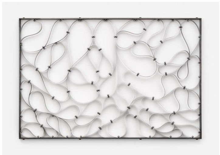
Spring Steel Drawing (Framed Lamellos) , Metal, Magnet (2020)