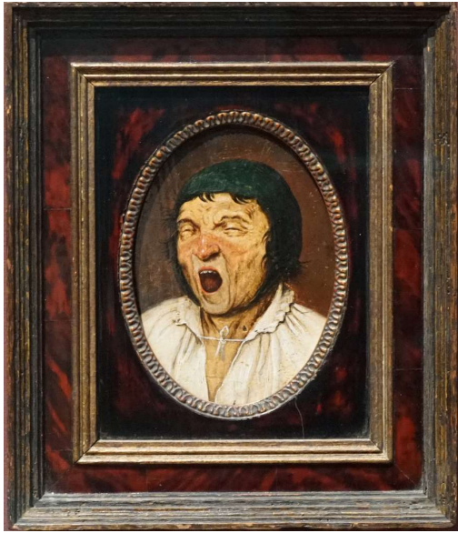
Yawning Man , Pieter Bruegel (after), oil on panel, 12 x 9cm, end 16 th c., Royal Museums of Fine Arts of Belgium, Brussels

Depuis les années 1990, le tableau Le bâilleur a influencé Michel François et sa réflexion sur le bâillement. La figure de la « contagion » par excellence. La peinture de Brueghel sera présentée à Bozar dans une installation spécifique.