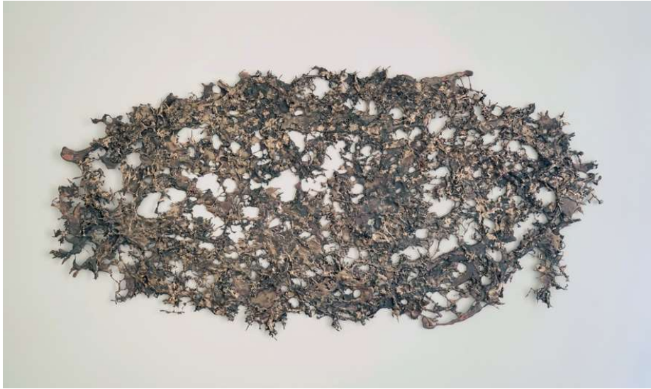
Instant Graffiti , bronze