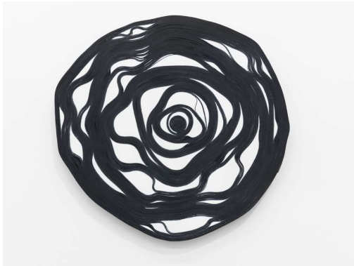
Enroulement , plaster, rubber, (2010)