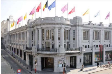
Centre for Fine Arts Brussels