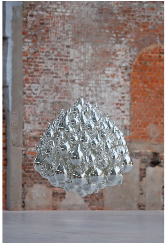
Souffles dans le verre , glass, (2021)