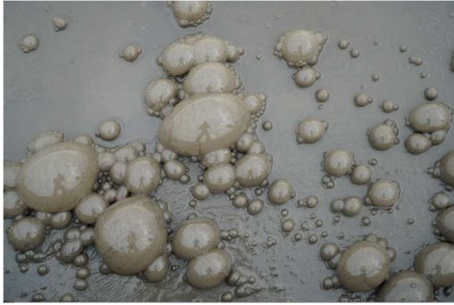
Mud volcano , video still (2021)

Ses expositions ont la particularité d'être finalement des œuvres « totales », formant un tout cohérent, tout en étant constituée de manière fractale d'une myriade d'éléments autonomes. La spécificité de l'œuvre de François réside dans l'extrême diversité de ses matériaux, de ses formes et de ses échelles, tout en présentant une grande cohérence stylistique au cours des 40 dernières années.