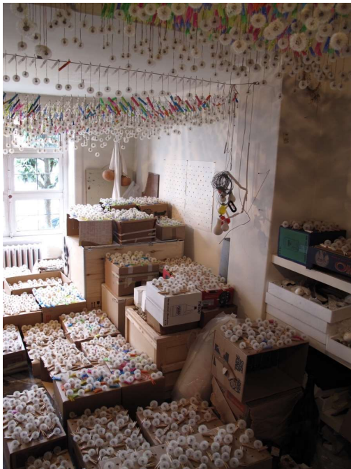
Studio pictures of dandelions for uminium, 2018