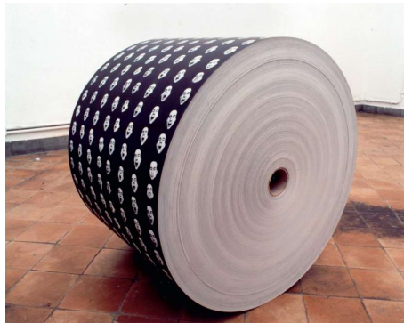
680 000 Baileurs , édition Vereniging voor Kunst, Gent (1991), collection FRAC Provence Côte d'Azur