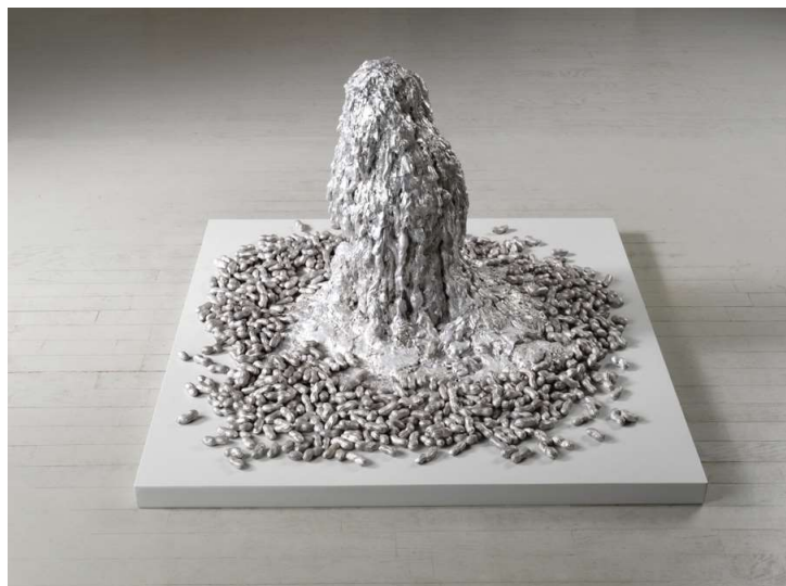
Lost peanuts , aluminium, 2018